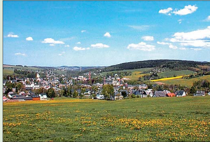
Thalheim, die Sport- und Erholungsstadt im Zwönitztal.

Der Erzgebirgswald und die Gastfreundschaft der Thalheimer und Brünloser Bevölkerung bieten die besten Voraussetzungen dafür.